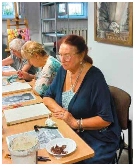
Warsztat pisanie ikon - start