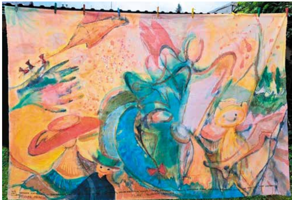
Praca zbiorowa Kołobrzaska impresja 2023, płótno, akryl