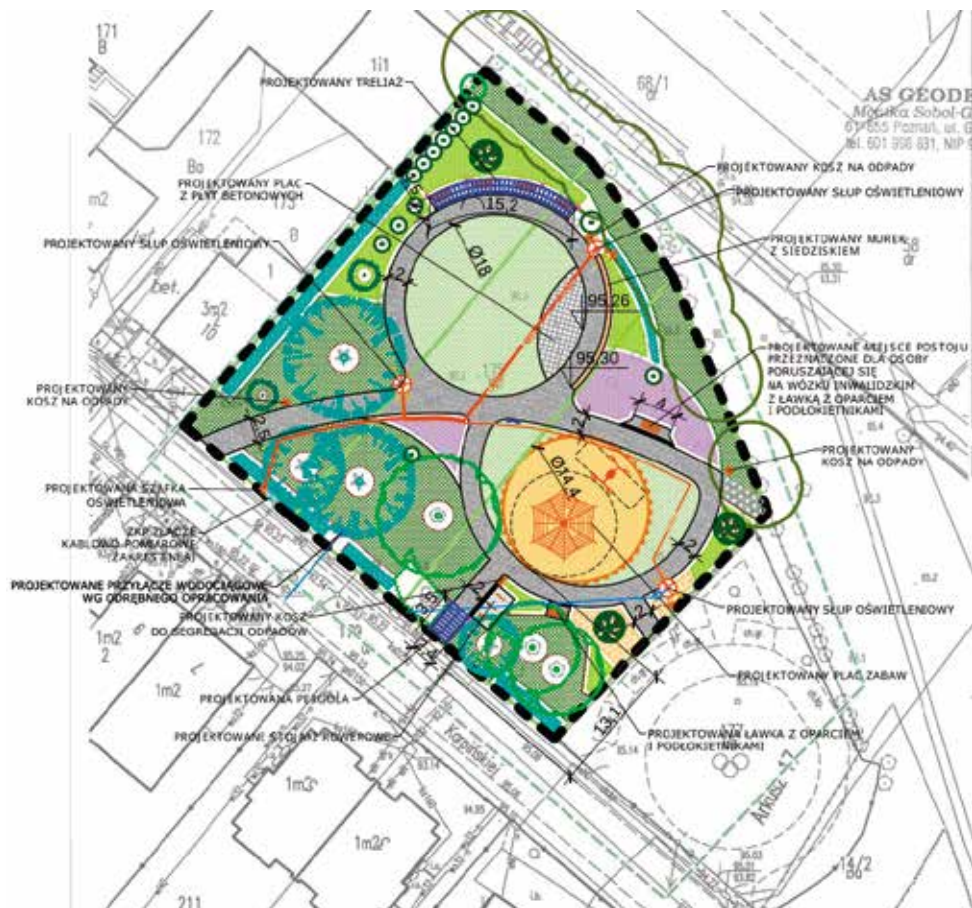
Projekt zagospodarowania skweru przy ul. Karpińskiej

W poprzednich latach, staraniem Rady Osiedla Podolany i ZMM, zagospodarowany został skwer wraz z Pomnikiem Poznańskich Harcerzy oraz placem zabaw, następnie Miasto przychyliło się do naszego wniosku i przekazało kolejne trzy działki pod zielen. Głosami 8321 osób w Poznańskim Budżecie Obywatelskim 2022 zdobyliśmy ok. 164 tys. zł na tą inwestycję, ale - jak wszystkim wiadomo - ceny galopują