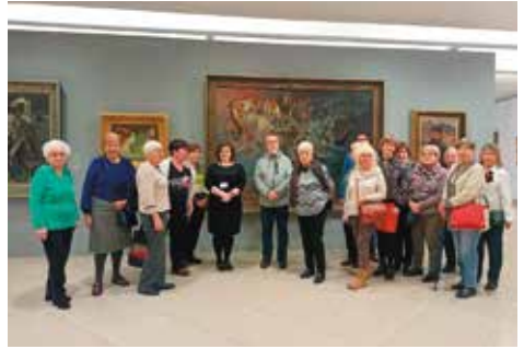
Galeria Malarstwa w Rogalinie