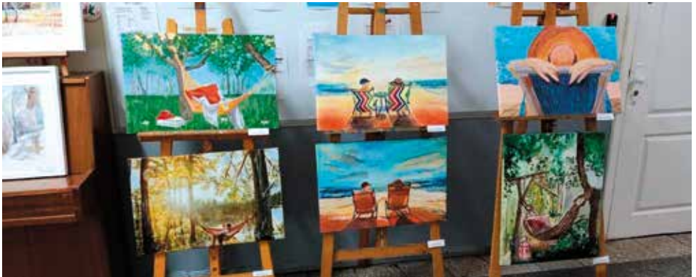
II edycja wystawy pt. 4 pory roku w Holu Parterowym ZSP nr 15