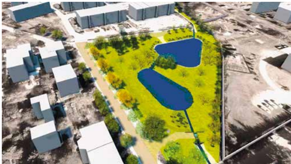
Projekt zbiorników przy ul. Straży Ludowej

Aquanet Retencje przygotowuje projekt zbiorników retencyjnych przy ul. Straży Ludowej, a Rada Osiedla wraz z ZDM stara się zaradzić lokalnym podtopieniom poprzez wymianę fragmentów nawierzchni asfaltowej na chłonną