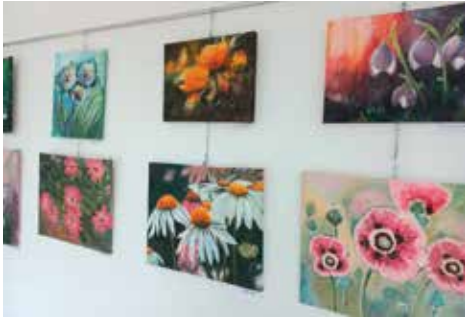
Wystawa 4 pory roku w Galerii Pod Arkadami