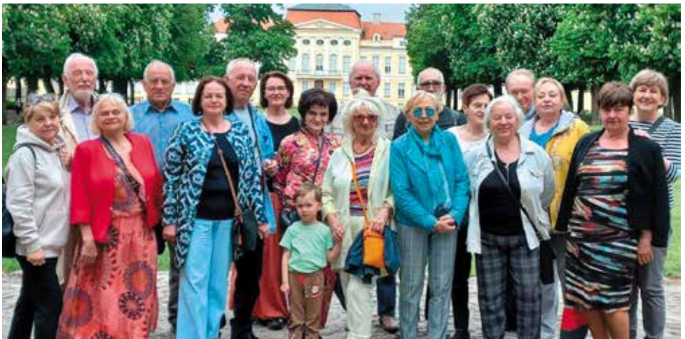
Wycieczka do Pałacu w Rogalinie