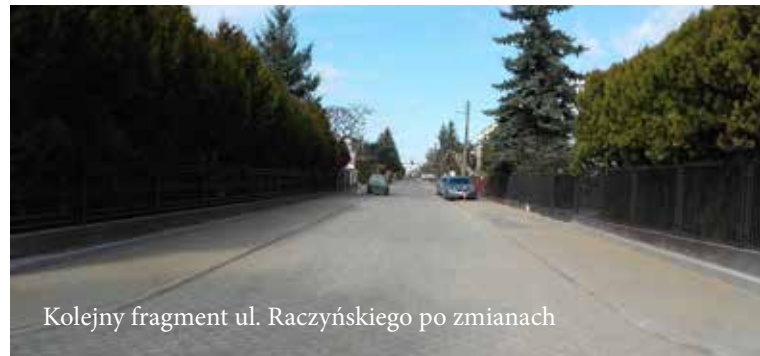
Kolejny fragment ul. Raczyńskiego po zmianach