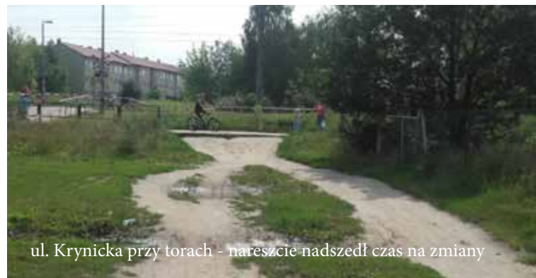
ul. Krynicka przy torach - nareszcie nadszedł czas na zmiany

Rada Osiedla informuje, iż w miesiącu maju, ze środków Osiedla, zostanie wykonany remont ulicy Kartuskiej. Remontowane będą odcinki od ul. Strzeszyńskiej do Nałęczowskiej oraz od ul. Bieckiej do Muszyńskiej. Odcinek od ul. Zakopiańskiej do Bieckiej zostanie odnowiony przez Aquanet S.A. po wykonaniu planowanej modernizacji sieci wodociągowej. W miarę możliwości prosimy mieszkańców o korzystanie w tym czasie z rowerów i spacerów w drodze do kościoła.