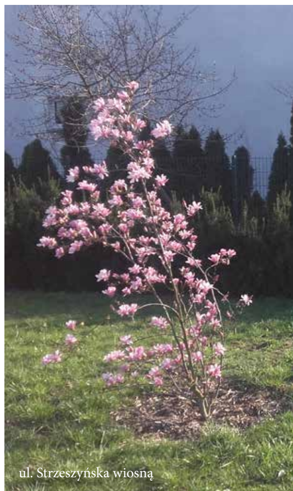
ul. Strzeszyńska wiosną